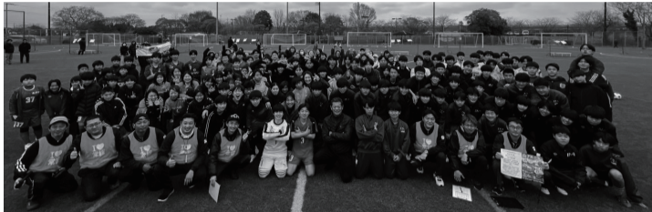
参加された皆様と集合写真 [小学生・中学生・女性の部]

大会二日目は「小学生・中学生・女性の部」を開催、優勝賞金25万円を目指して、100チームによるトーナメント戦が行われました。試合は負けつら終わりの一発勝負で行われ、一球ごとに静寂と感嘆の声が交互に訪れる真剣勝負に会場は大いに盛り上がりました。今年も波乱に満ちた展開が続き、決勝戦は高校生チーム同士の対決となりました。緊張感の高まる中、両者一步も譲らない攻防が続きました。サドンデスの末決着となりました。本大会ではスポーツを通じて、たくさん地域の人たちが交流することができ、有意義なイベントとなりました。