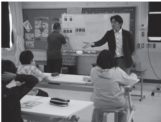
マグネットシートを使った授業の様子

租税教室は、次代を担う子供たちに租税の意義や役割を正しく理解してもらい、社会の構成員として税金を納め、その使い道に関心を持ち、更には納税者として社会や国の在り方を主体的に考える自覚を育てるために「租税教育推進協議会」の事業の一環として開催しています。租税教育推進協議会の構成メンバーで