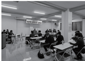
議案を審議する様子