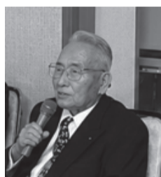
挨拶を行う長岡会長