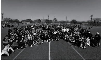
参加された皆様と集合写真 [大人の部]