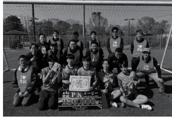
大人の部で優勝された「植竹FC」の皆様

令和8年3月20日(金・祝)から21日(土)の2日間、吉野サン・ビレッジにて常総市商工会青年部主催のイベント『第4回常総PKダービー』を開催しました。今回で4回目の開催となる本イベントは、近隣の市町村だけでなく県外からもたくさんの方にご参加いただき、小学生から大人まで延べ120チームの選手たちがPKによる熱戦を繰り広げました。