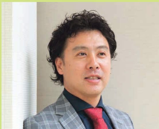
(株)ファースト・イニシアチブ代表取締役 中小企業診断士