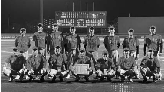
野球大会に参加された部員の皆さん