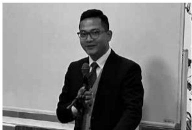
流暢な日本語で全力投球の講義を行うグエンカックタウン社長

一つである外国人技能実習制度についての詳細な説明がありました。研修会終了後に行われた交流会では、講師とご来賓を交え情報交換を行うと共に懇親を深めました。