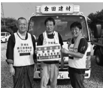
ボランティアに参加した部員