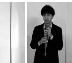
日本政策金融公庫と茨城県信用保証協会からは資金調達についてレクチャー