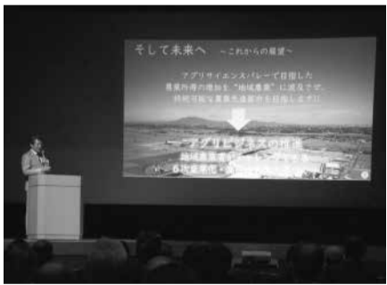
アグリサイエンスバレー AIまちづくりを説明する神達岳志市長