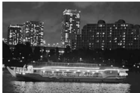
夜景を背景にした屋形船

者が参加しました。当日は、あいにくの雨模様でしたが、2時間半の遊覧コースの後半には雨も上がって、美味しい料理を堪能しながら、スカイデッキからの夜景を楽しみました。