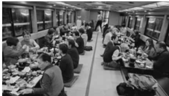
料理を楽しむ皆さん

石下サービス会は、10月9日(月)に招待事業「隅田川屋形船の旅(サービス券30冊で1名を招待)」を実施し、26名の招待者・事業