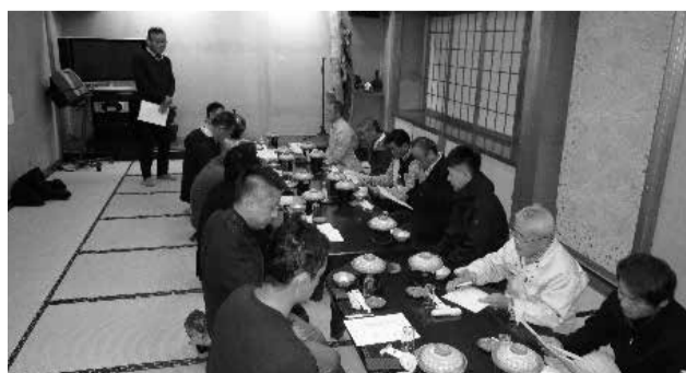
挨拶する生井支部長(上)と木村支部長(下)