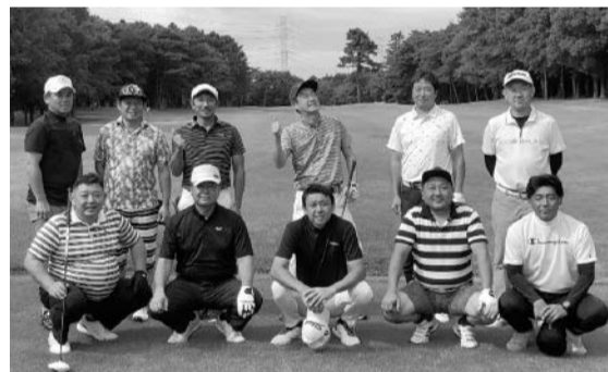
笑いが絶えなかった部員

令和5年9月26日に 筑波東急ゴルフクラブにおいて、ゴルフコンペを開催しました。当日は天気にも恵まれ、25年ぶりにコースに出る部員、日頃の練習の成果を活かして笑いを誘う部員などいつも以上に親睦交流が図られました。終了後は、会場を「居酒屋ぐうの音」に移して懇親会を開催して、昼間の珍プレーを肴に楽しい時間を