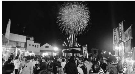
多くの来場者で賑わったイベント会場

令和5年10月28日の「常総きぬ川花火大会」開催にあわせて、水海道宝町地内の市民の広場において、市内の飲食店のPRと市街地に賑わいをもたせることを目的に、キッチンカーなど13事業所の出店のもと「常総グルメin市民の広場」を開催しました。当日は、午前中の雷雨の影響もあり、開始後しばらくは客足が鈍かったのですが、花火大会開始時間が近づくにつれ多くの来場者が詰めかけ、花火大会開催時間中は、ブースに行列ができるほど賑わいをもたせることができました。壮青年部としてはじめてのイベントであり、不安もありましたが、出店者から継続開催を望む声上がるなど高い評価をいただき、無事成功裡に終えることができました。