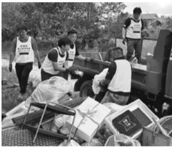
ボランティア協力の様子

令和5年9月の台風13号の影響により、県北地域を中心に甚大な被害が発生しました。県商工会青年部連合会から人道支援の要請があり、9月17日に青年部と連携して高萩市でボランティア協力を行ってきました。住宅等の濡れた家財の片付けや搬出・運搬を行い、被災者の一刻も早い生活再建のため協力してきました。今後、平成27年の常総市で発生した水害で受けた恩を返すために活動を継続していきます。