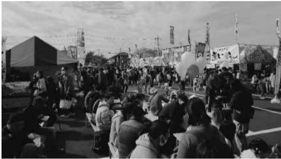
出店ブースは大盛況でした

令和5年11月23日に常総市地域交流センターにおいて、常総ふるさとまつりが開催されました。当会もまつり全体を盛り上げるため、商工まつりとして40の事業所と団体によるブースと毎回大好評の福引抽選会で協力いたしました。今年も会場が変わりましたが、天候にも恵まれ、多くの方にお越しいただきました。出店ブースでは商品が売り切れるなど無事盛大のうちに終えることができました。