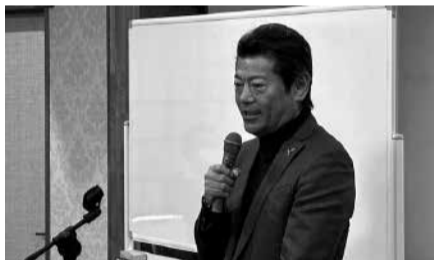
「道の駅常総」100万人突破!常総市の明るい未来を熱く語る神達市長