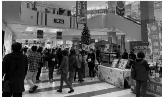
多くの来場者で賑わった物産展

令和5年11月11日～12日の2日間、イオンモール下妻1階フォレストコートで八千代町商工会が主幹となり、常総市商工会、下妻市商工会、筑西市商工会が合同で物産展を開催しました。この物産展は、当会の経営発達支援計画に基づいて地域商工業者の販路拡大を支援するために開催をしたもので、当会から3事業所を含め全11事業所が出展しました。 事前に「リアル店舗の販促すぐネタ」セミナーを受講していただき、チラシやPOPなどの販促物が大きな効果を上げるポイントについて学び、当日の出展となりました。各事業所とも