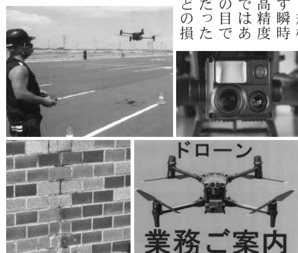
ドローン 業務ご案内

ドローンの資格だけで なく、そのうち一名は一 級建築士、一名は赤外線 技能資格を有しています。 既存の方法では近づく のに時間を要する場所 にもドローンなら規模 の大小を問わず瞬時に に接近可能。高精度 カメラで一例ではあり ますが、人の目では 把握が困難だった 外壁、屋根などの損 傷を赤外線力 メラ使用で動 画・写真で可 視化し判別 でき、お役にた てる事と存じ ます。一級建 築士と赤外線 技能者のコン