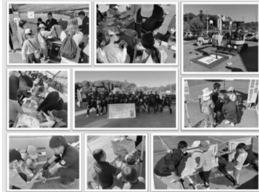
ぎょうかいウォッチ2024

商工会青年部では令和5年10月22日(日)に部員29名参加のもと、水海道あすなろの里において「あすなろの秋まつり」と同時開催で、職業体験イベント『ぎょうかいウォッチ』を開催しました。本イベントは、子どもたちが青年部員のさまざまな仕事を実際に体験し、仕事の役割やモノ作りの楽しさを学ぶことを目的としたイベントとなっております。今回は、建設屋さんによる重機を使った小物作りなど、合計7種類の体験ブースを設置しました。当日は晴天にも恵まれ、たくさん子どもたちにご来場いただき、笑顔で楽しそうに体験する姿や仕事へ真剣に向き合う