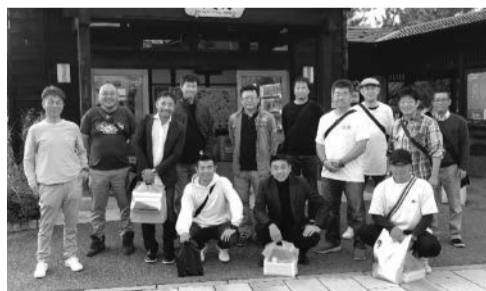
視察研修に参加した部員

令和5年11月5日、6日に視察研修を実施しました。視察先は、「月岡温泉空き家再生店舗」。この店舗は、月岡温泉の若手経営者の共同出資で設立された運営会社がプロジェクトを展開。温泉街にある空き家、遊休地をお酒や米お茶など新潟をテーマとした素材にスポットを当てたオリジナリティあふれる店舗として蘇らせ、観光地の新たな景観の再生とにぎわいの創出に取り組んでいました。これまでに