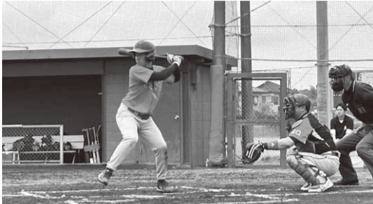
▲決勝戦で下妻市と対戦する様子

緊迫した試合展開が続きました。しかし、試合後半、常総の打線が爆発、6回7回に続けて10得点を挙げる