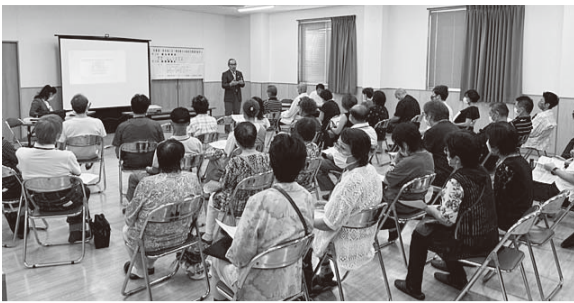
▲顧客サービス向上のため毎回多くの会員が参加

底や、顧客の多様なニーズに 応えることを目的とし、長年 継続しているものです。 今回は、つくば保健所による 感染予防対策についての衛生 講習に加え、茨城県よろず支 援拠点の協力により、中小企 業診断士などの専門家から 「料金アッププランの提案と 収益力向上の秘訣」をテーマ