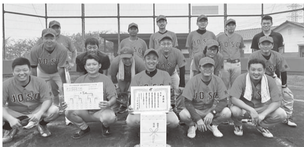
▲野球大会に参加された部員の皆さん

と、そのまま押し切って12対4で勝利し、優勝することができました。昨年は決勝戦で敗れてしまったため、名誉挽回を果たすことができたほか、部員同士の親交がより一層深まる実りある大会となりました。また、10月には県西地区の代表として県大会へ出場することとなりました。