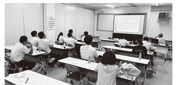
▲4日間でたくさんの受講者があつまりました