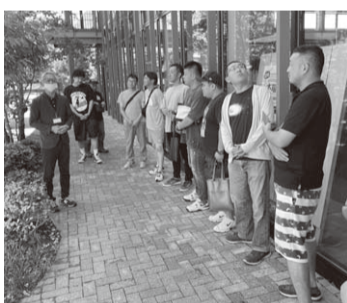
▲施設の説明を受けている様子