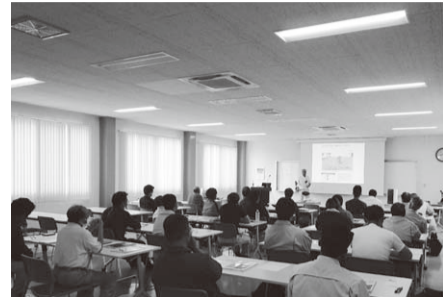
▲講習会を受ける皆さま

商工会では、労働安全衛生法に基づく資格取得のための各種技能講習として、建設業労働災害防止協会茨城県支部常総分会と協定を結び、6月30日に刈払機取扱作業講習会、7月3日～5日に地山の掘削及び土止め支保工作業主任者講習会を開催しました。講習会では、建設業にかかる技能を身につけました。