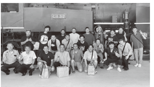
▲研修会に参加された部員と島田市商工会青年部の皆さま