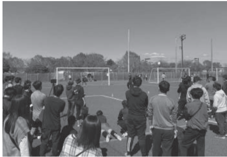
試合を観戦する参加者