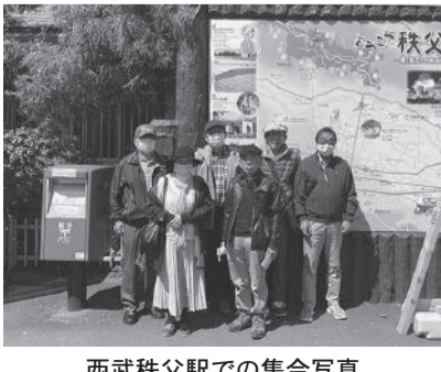
西武秩父駅での集合写真

視察研修会を実施しました。行き先は、埼玉県秩父市・長瀬町方面で、午前中は秩父市内において羊山公園の散策、秩父神社の参拝、秩父まつり会館の見学をしました。午後からは長瀬町の宝登山神社を参拝しました。