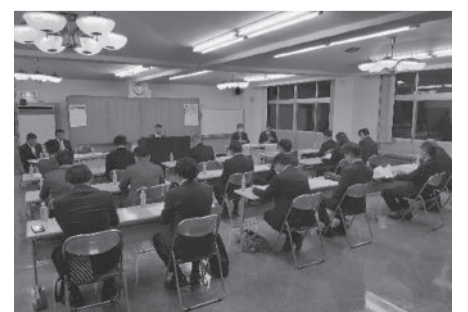
議案を審議する総会の様子

の将来像についての講和があり、参加者は熱心に耳を傾けていました。終了後の懇親会では、県内各地の壮青年部員との交流が活発に行われ、大変有意義な研修事業となりました。