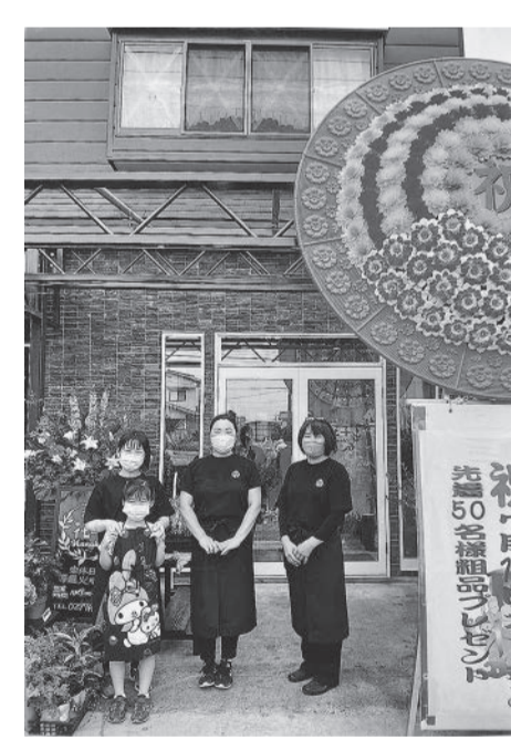
七月のオープン時

元々、岡田生花店として生花販売業を営んでまいりましたが、場所を移転し、心機一転、花屋花子として二〇二二年七月にオープン致しました。生花・鉢物・プリザーブドフラワーを取り扱って おります。 お家時間が少しでも気分良く過ごせる様にフレッシュで持ちが良く、きれいなお花をお客様に提供できるように日々努力しております。お誕生日や記念日等のお祝い事は