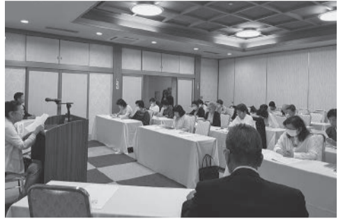
議案を慎重に審議する出席者の皆さん

工会長にご出席いただきました。提出議案は、議案第1号令和4年度事業報告並びに収支決算、議案第2号令和5年度事業計画並びに収支予算について、両議案とも原案通り可決されました。