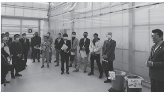
神達市長による説明

として「アグリサイエンスバレー常総」の現地視察と神達市長による講演会を開催。4月28日にオープン予定の道の駅をはじめとする新たな交流と産業の拠点となる事業について見識を深めるとともに市内外に情報発信することを目的に、県内の商工会壮青年部関係者にも声掛けをし、35名の参加をいただき実施しました。神達市長及び市役所担当課の職員の方から、それぞれの施設の説明とこの事業による経済効果など周辺を徒歩で移動しながら詳しく案内していただきました。会場を商工会に移して開催した講演会では、AIによるまちづくりを含めた常総市